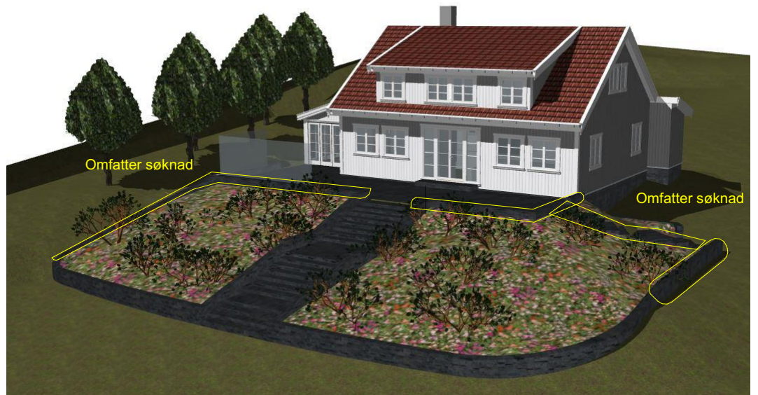
Illustrasjon fra 3D modell mot syd